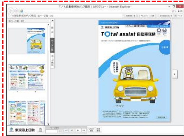
《パンフレット兼重要事項説明書イメージ》

ご契約にあたっての確認事項をご確認いただき、 該当がなければ『次へ進む』をクリックしてください。